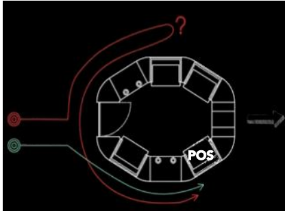
Flux non précis